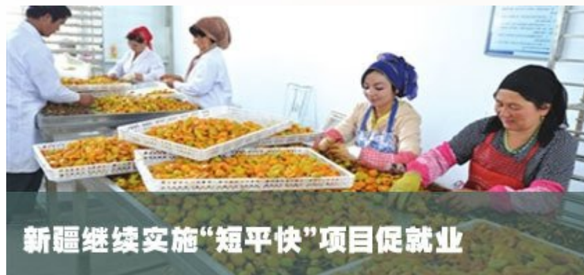
新疆继续实施“短平快”项目促就业